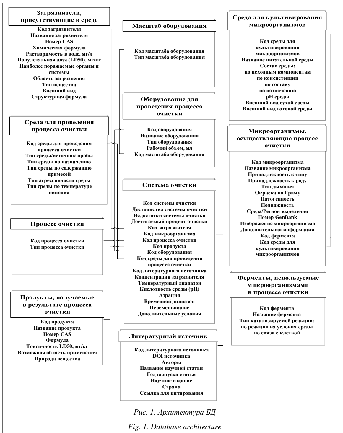
Рис. 1. Архитектура БД