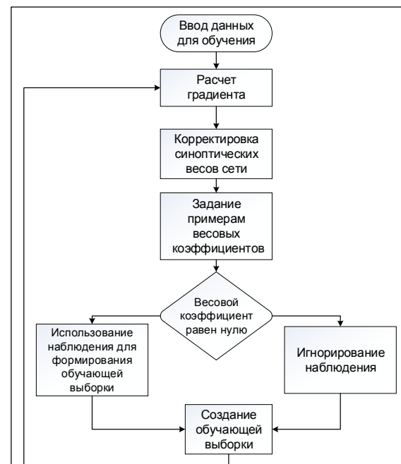
Рис. 3. Блок-схема алгоритма обучения нейронной сети с использованием адаптивной функции ошибки

Предложенная реализация алгоритма обучения позволяет избежать переобучения нейронной сети, связанного с чрезмерным стремлением достичь нулевой ошибки. При этом данный алгоритм в большей степени учитывает свойства малочисленных групп примеров, чем стандартный алгоритм. Блок-схема алгоритма изображена на рисунке 3.